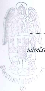
Eva Herínková náměstkyně primátora města Plzně