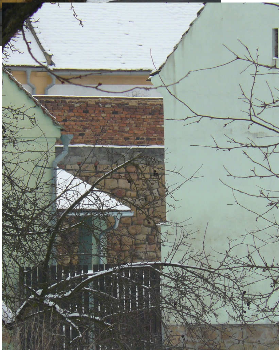
Rolnické náměstí 5a, Plzeň-Lobzy – západní část bývalé svobodnické usedlosti čp. 1, (dnes čp. 1155 a čp. 1205), nahoře – pohled z návsi, dole – průhled k opěrné zdi dvorem čp. 2, nemovitá kulturní památka rejst. č. 24277/4-210 ÚSKP.