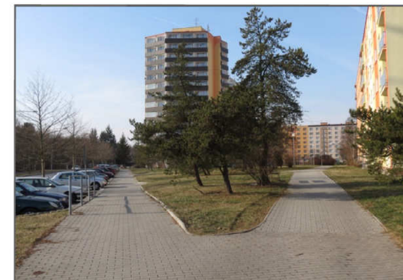
VNITROBLOK HEYROVSKÉHO - ŠIMEROVA REALIZACE: 2006, NÁKLADY: 6 632 000 Kč