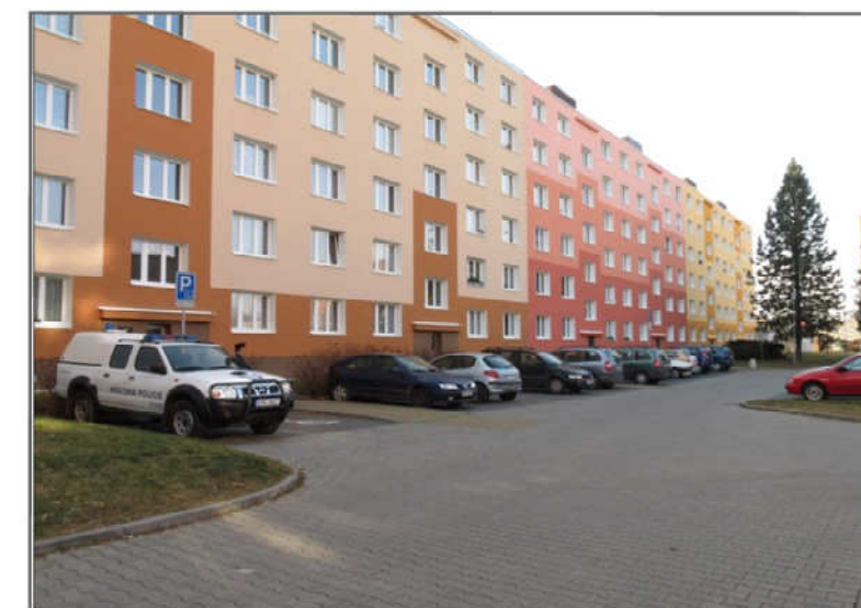
VEŘEJNÉ PROSTRANSTVÍ A KOMUNIKACE HEYROVSKÉHO REALIZACE: 2002, NÁKLADY: 10 687 000 Kč