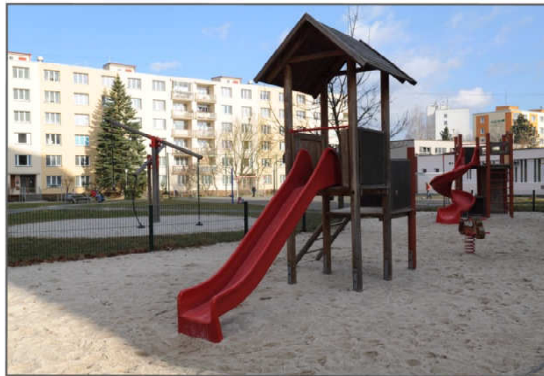
VNITROBLOK BAAROVA - HEYROVSKÉHO - SKUPOVA REALIZACE: 2004, NÁKLADY: 8 577 000 Kč