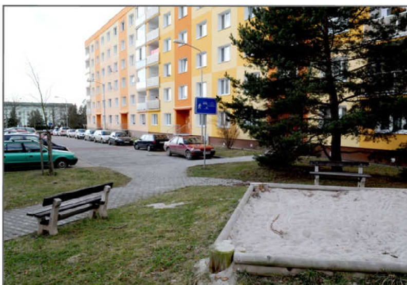
VNITROBLOK U BORSKÉHO PARKU REALIZACE: 2008, NÁKLADY: 14 701 000 Kč