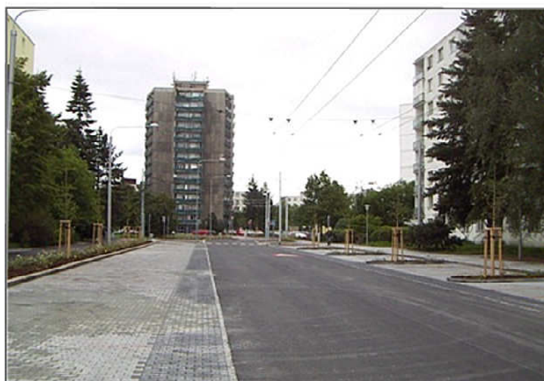
VEŘEJNÉ PROSTRANSTVÍ SKUPOVA I. ETAPA REALIZACE: 2006, NÁKLADY: 8 279 000 Kč