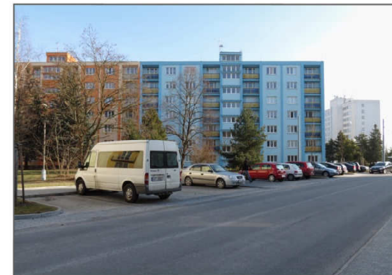
VEŘEJNÉ PROSTRANSTVÍ MAJEROVA - HEYROVSKÉHO REALIZACE: 2010, NÁKLADY: 24 393 000 Kč