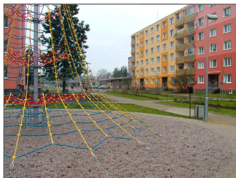
STÁVAJÍCÍ STAV - POHLED VÝCHODNÍ