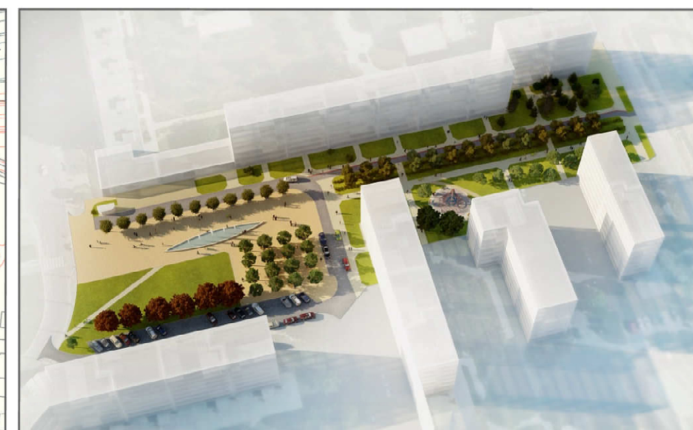
NÁVRH - NADHLED NA ÚZEMÍ