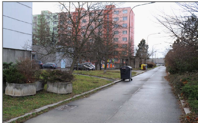
PŮVODNÍ STAV - POHLED VÝCHODNÍ