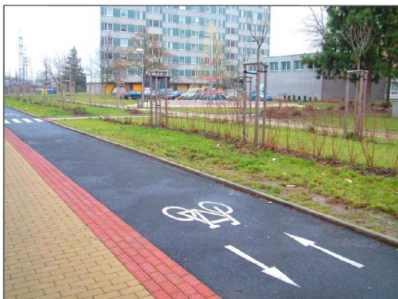
STÁVAJÍCÍ STAV - POHLED ZÁPADNÍ