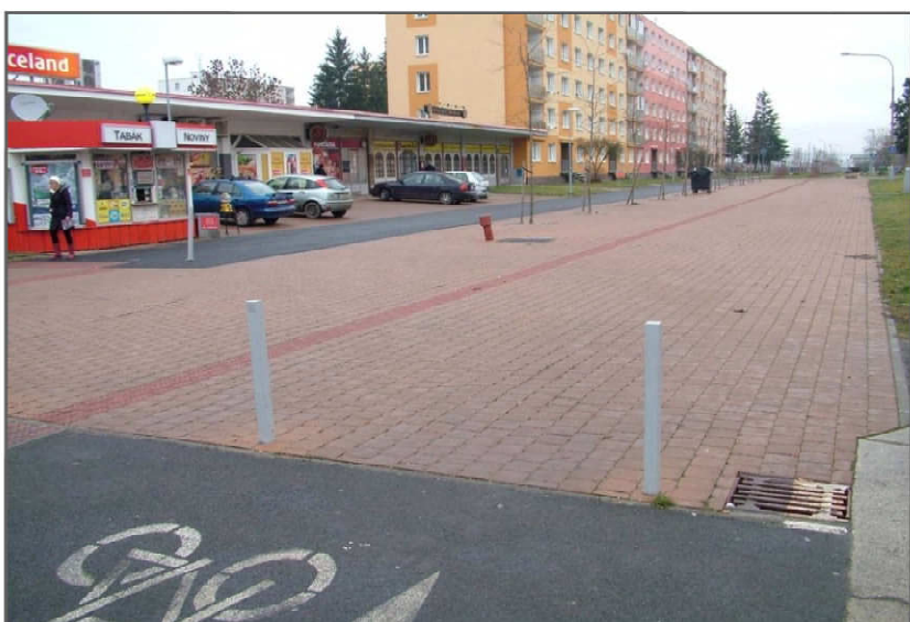
STÁVAJÍCÍ STAV - POHLED ZÁPADNÍ