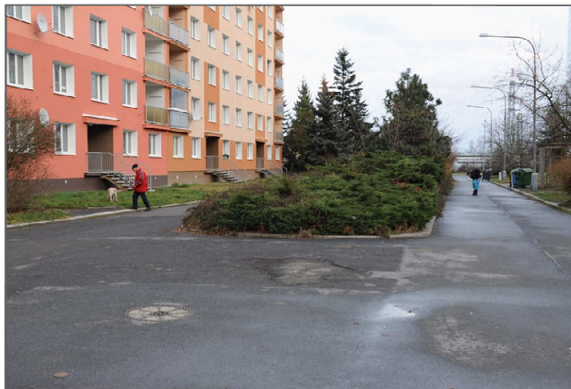
PŮVODNÍ STAV - POHLED VÝCHODNÍ