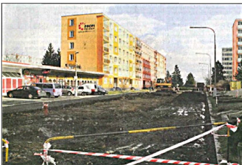
STAV ÚPRAV - POHLED ZÁPADNÍ