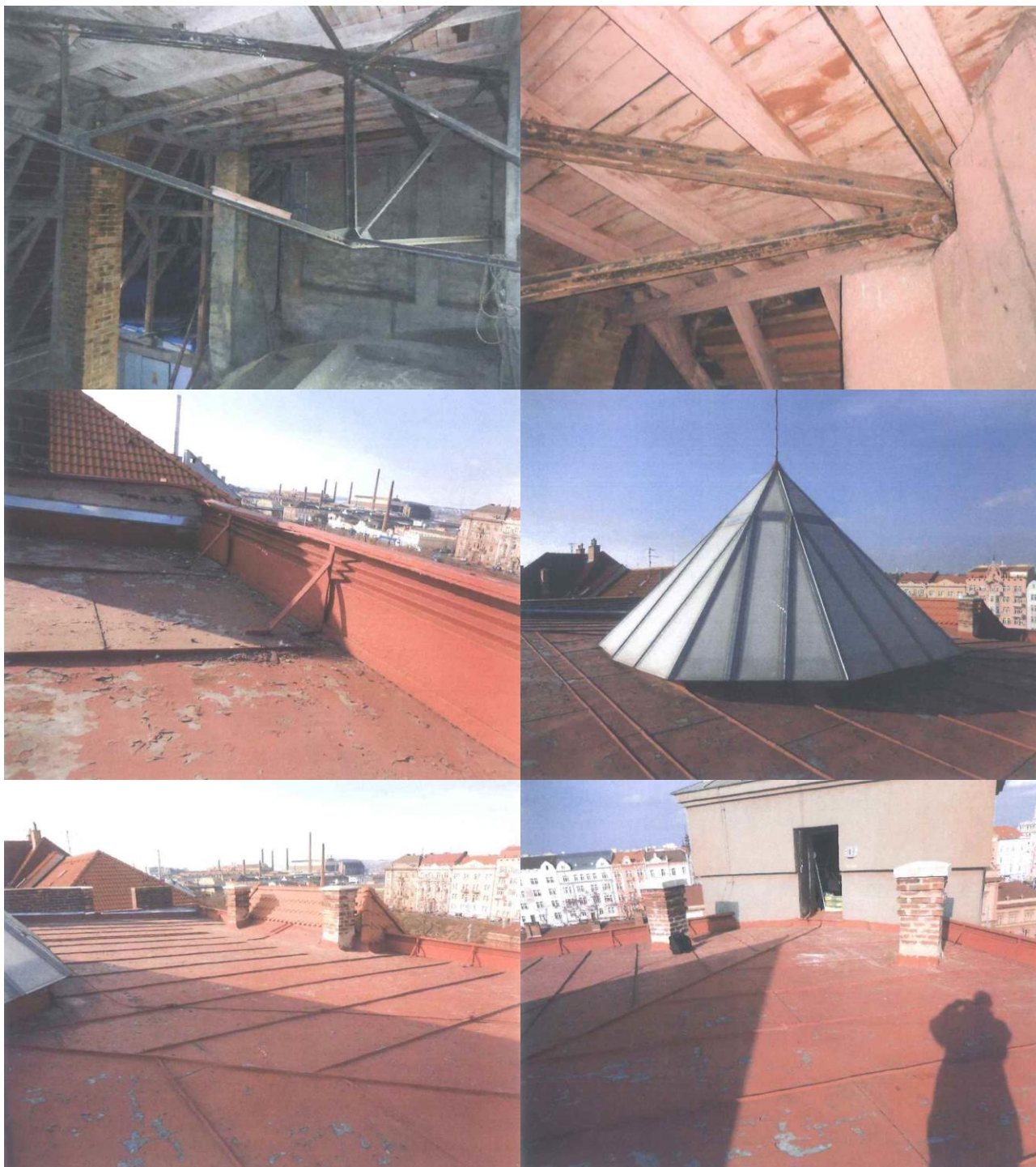
českobratrský kostel M. J. Husa čp. 1722, Němejcova 2, Plzeň, Details: stav krovu s bedněním, okraj střechy, středový světlík, atiky s komíny a vstup z věže, nemovitá kulturní památka rejst. č. ÚSKP 12805/4-4913.