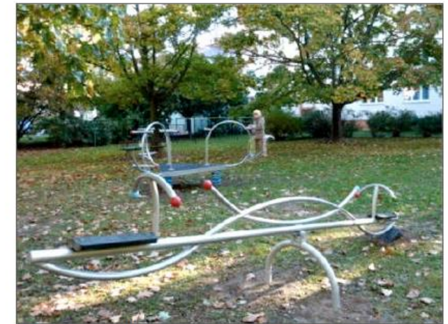
● ÚPRAVA VNITROBLOKU BLATENSKÁ - NA CELCHU REALIZACE: 2011, NÁKLADY: 99 000 Kč