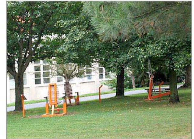
● BLOK KOTEROVSKÁ - ZA MĚSTSKÝM ÚRADEM REALIZACE: 2010, NÁKLADY: 127 000 Kč