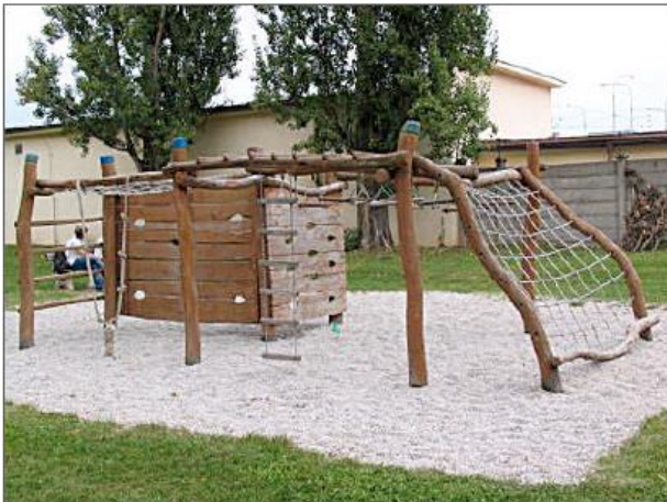
● ÚPRAVA VNITROBLOKU BROJOVA - SLOVANSKÁ ALEJ REALIZACE: 2006, NÁKLADY: 127 000 Kč