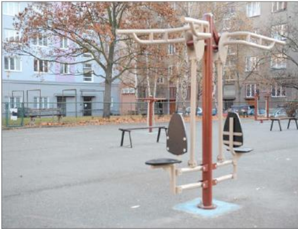
● ÚPRAVA VNITROBLOKU ZA "BERUŠKOU" REALIZACE: 2008 - 2010, NÁKLADY: 450 000 Kč