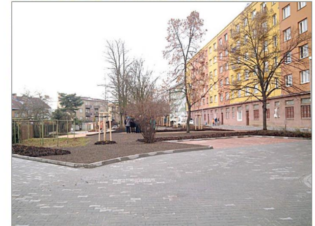
● ÚPRAVA VNITROBLOKU NÁMĚSTÍ GENERÁLA PÍKY - LUŽICKÁ - JABLONSKÉHO - HABRMANOVA

REALIZOVANÉ ETAPY V SÍDLIŠTI SLOVANY - VYBRANÉ PŘÍKLADY