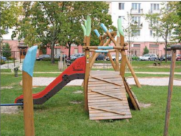
● ÚPRAVA VNITROBLOKU NEUMANNOVA - ČÁSTKOVA REALIZACE: 2009, NÁKLADY: 13 094 000 Kč.