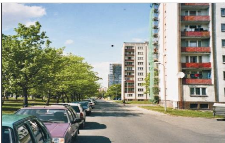
STÁVAJÍCÍ STAV VNITROBLOKU