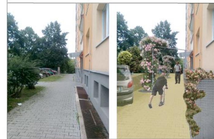
ÚZEMNÍ STUDIE KOTEROVSKÁ - CHVOJKOVY LOMY

REKONSTRUKCE VNITROBLOKU KOTEROVSKÁ – CHVOJKOVY LOMY ETAPA, NA KTEROU JE ŽÁDÁNO O DOTACI PRO ROK 2015 (I. ETAPA)