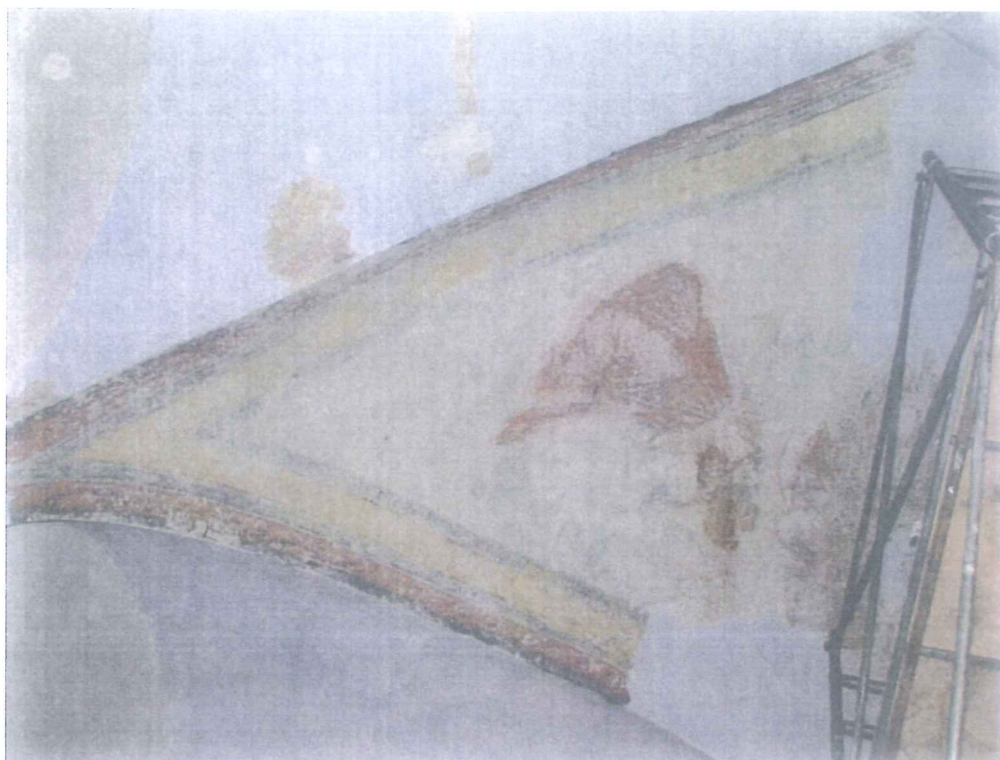
Pohledy na středové pole klenby při odkryvu.