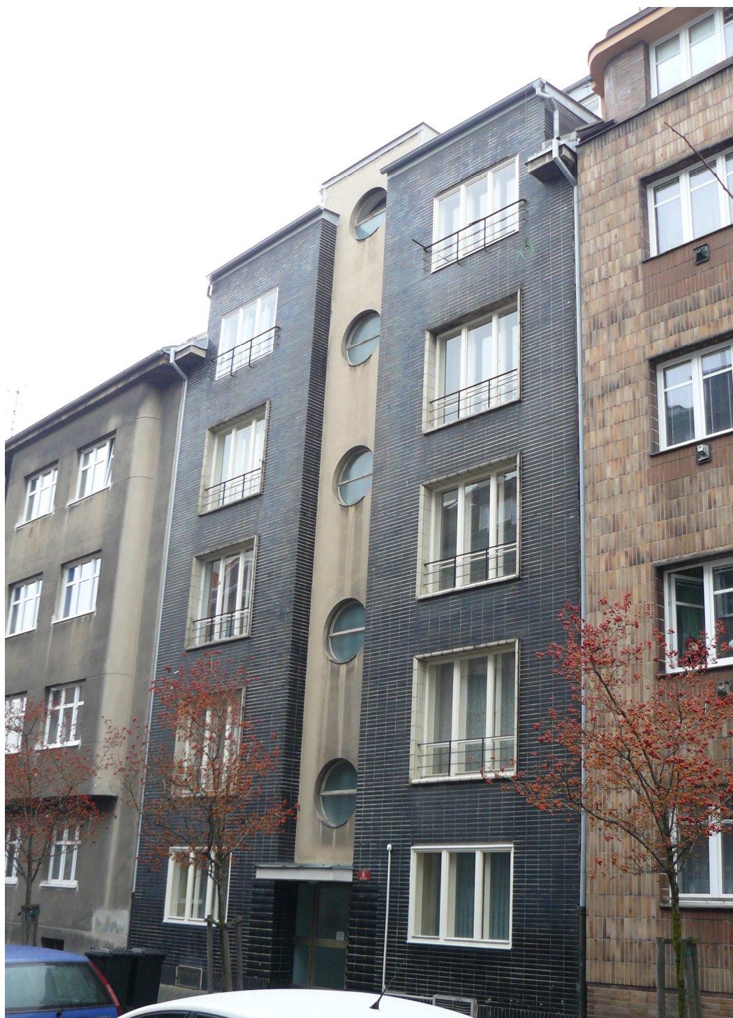
Meislův činžovní dům čp. 2185, Na Belánce 6, Plzeň, celkový pohled na uliční průčelí, nemovitá kulturní památka rejst. č. ÚSKP 101256.