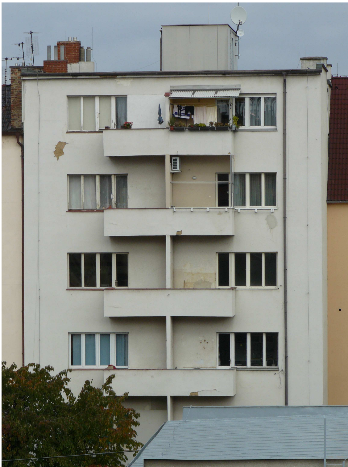
Meislův činžovní dům čp. 2185, Na Belánce 6, Plzeň, pohled na dvorní průčelí, nemovitá kulturní památka rejst. č. ÚSKP 101256.