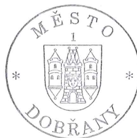
starosta města Dobřany