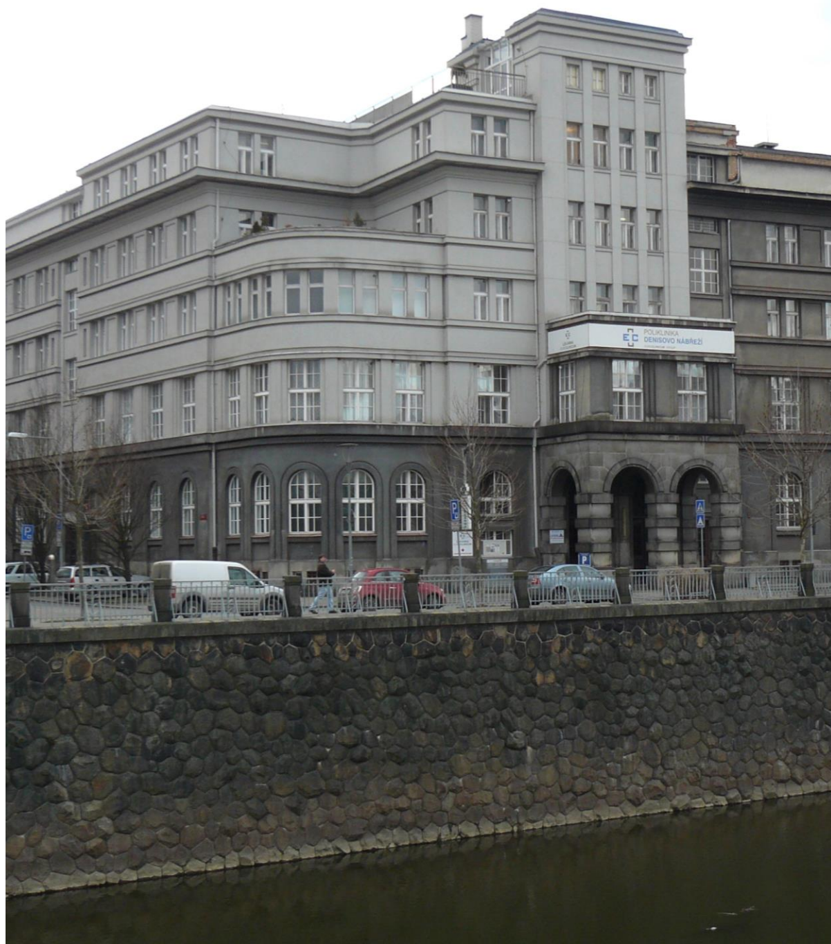
Budova bývalé Okresní nemocenské pojišťovny, dnes poliklinika čp. 1000, Denisovo nábřeží 4, k. ú. Plzeň – Pohled na průčelí s hlavním vstupem, nemovitá kulturní památka rejst. č. ÚSKP 49717/4-5143