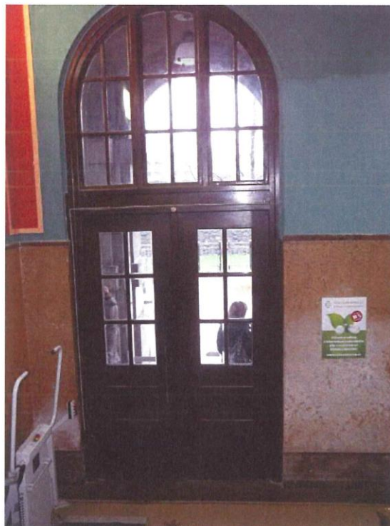
Pohled z vnitřní strany