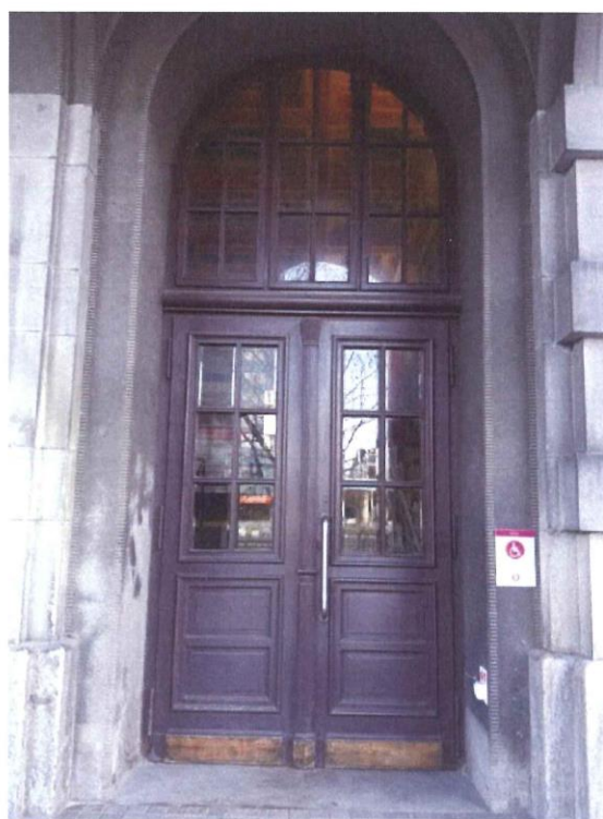
Pohled z vnější strany

Budova bývalé Okresní nemocenské pojišťovny, dnes poliklinika čp. 1000, Denisovo nábřeží 4, k. ú. Plzeň – pohledy na pravé vstupní dveře, nemovitá kulturní památka rejst. č. ÚSKP 49717/4-5143