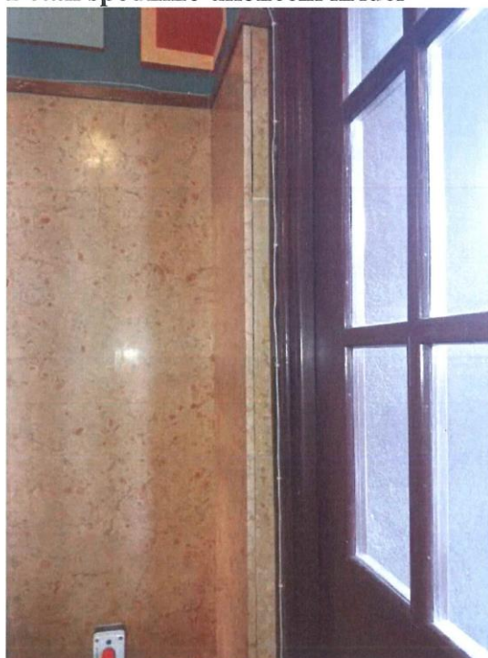
Detail konečného obložení

Budova bývalé Okresní nemocenské pojišťovny, dnes poliklinika čp. 1000, Denisovo nábřeží 4, k. ú. Plzeň – detaily poškození pravých dveří a kamenného obkladu, nemovitá kulturní památka rejst. č. ÚSKP 49717/4-5143.