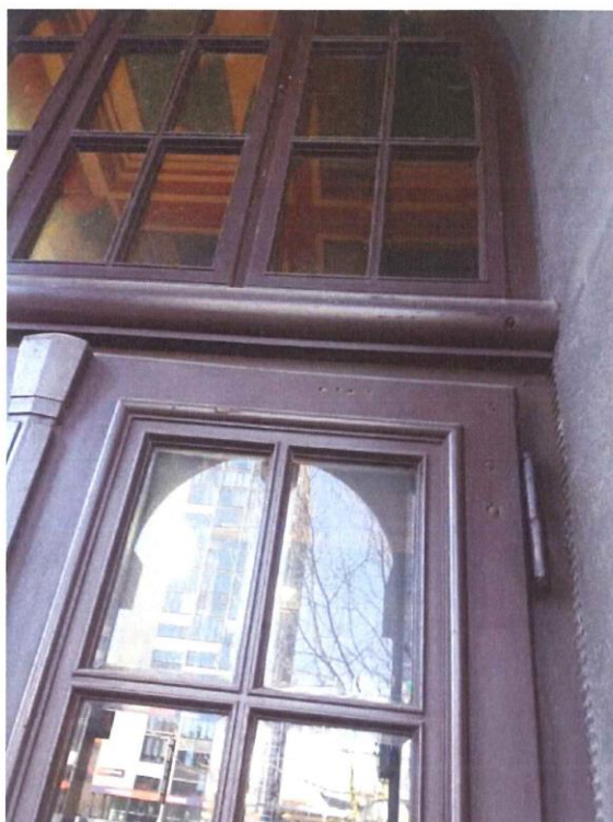
Detail uchycení pantů