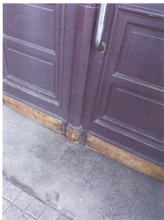
Detail spodního ukončení křídel