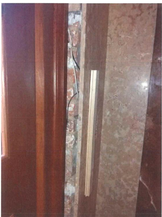
Detail doplnění poškozeného obložení